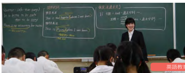
英語教育実習の授業