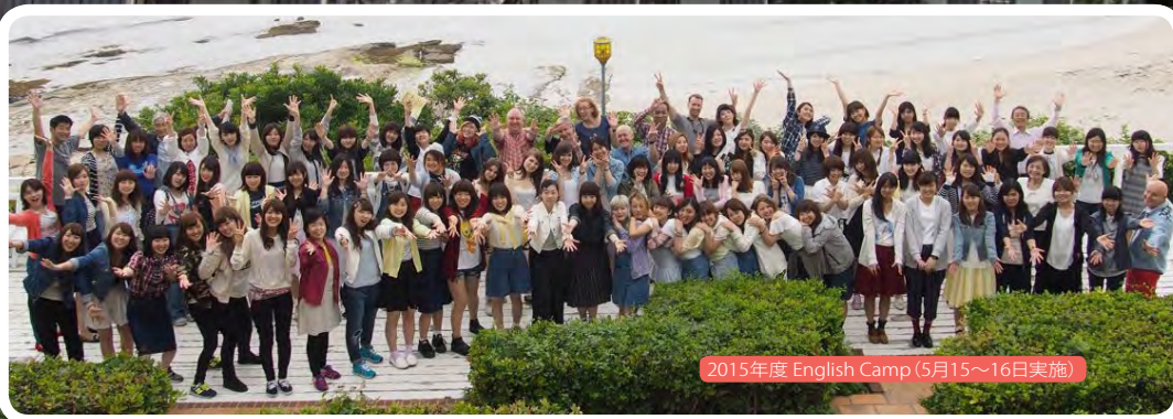
2015年度 English Camp (5月15～16日実施)

入学した学生たちは、それぞれに個性をもち、異なった伸び代をもっています。英語学科ではそのような学生たちを入学時から卒業時まで、幅広い側面から継続的にサポートしています。その結果、就職先は、エアライン関係、一般企業関係、教育関係など多岐に渡っています。