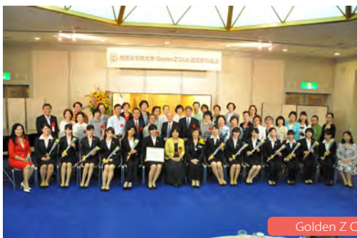
Golden Z Clubの認証式