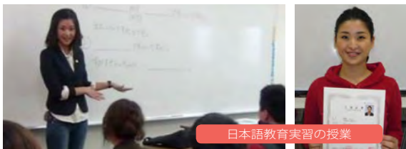
日本語教育実習の授業