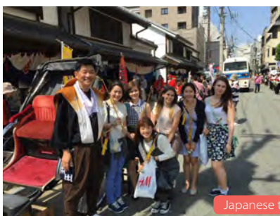
Japanese teaching volunteers